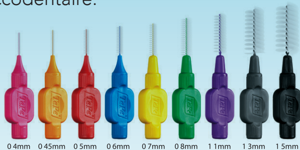
Brossette interdentaire TePe Original™.

La brosse TePe Compact Tuft™ et sa touffe arrondie, compacte et ferme, est idéale pour le soin des prothèses .